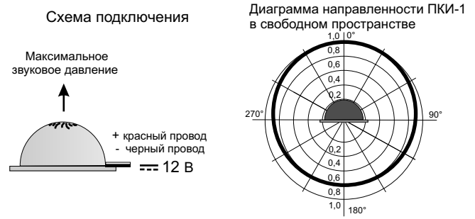
Рис.2 Схема подключения и диаграмма направленности оповещателя ПКИ-1.

5.3. На рис.2 показана схема подключения и диаграмма направленности звука оповещателя ПКИ-1.