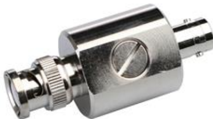
Рис.3 Вид сзади SP-SDI/1