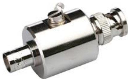
Рис.2 Вид спереди SP-SDI/1