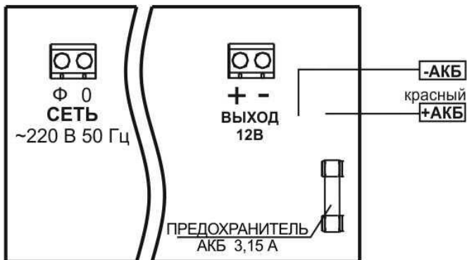
Рисунок 2 — схема подключения.