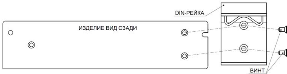
Рисунок 2 – крепление DIN-рейки.