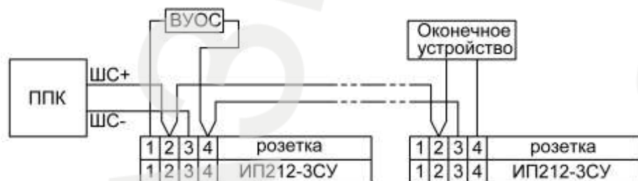
Рисунок 1 – Схема включения

На рис.1 показана типовая схема включения в двухпроводный шлейф пожарной сигнализации при фиксации сигнала «ПОЖАР» по одному извещателю. Схема и номиналы оконечного устройства, определяют производители ППК. Схема включения с фиксацией сигнала «ПОЖАР» по двум извещателям, а также расчет сопротивлений приведены на сайте компании-разработчика.