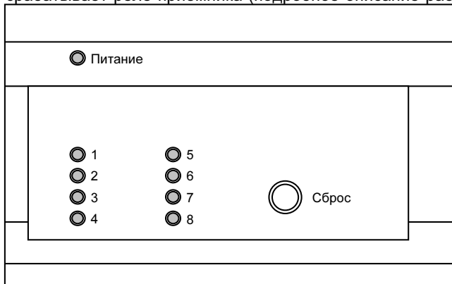
Рисунок 1. Внешний вид приемника (надписи показаны условно)

При тревоге срабатывает реле приемника (подробное описание работы релейного